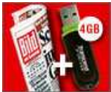
Bild am Sonntag

9x lesen nur 6 x zahlen! Sichern sich jetzt als Geschenk den 4 GB Transcend USB-Stick!