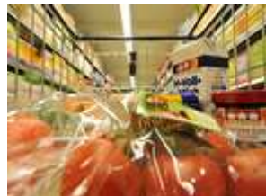
Lebensmittel